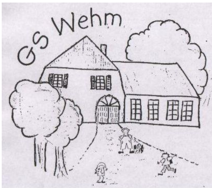
Grundschule Wehm, Wehmer Straße 96, 49757 Werlte-Wehm